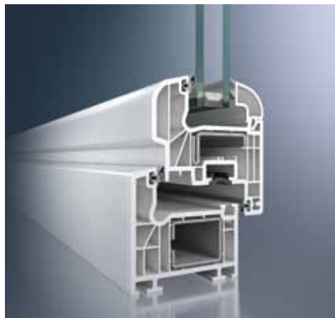
Schüco Corona CT 70 Rondo

De Classic-vleugelgeometrie met de duidelijke, strakke en tijdloze lijnvoering vervult de voorwaarden van moderne architectuur met behulp van de gereduceerde vormtaal.