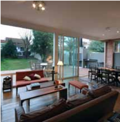
Liefdevol en met respect voor de stijl gerenoveerd – het karakter blijft behouden.