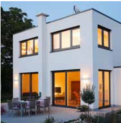
Hoogwaardige raamtechniek in moderne gebouwen.

Al deze voorwaarden vereisen absolute precisie bij het opmeten, de fabricage en de inbouw. Want een eigentijds raam vervult vandaag in essentie meer taken en vereist naast moderne productiefaciliteiten ook geschoold vakpersoneel, dat zorgt voor kwaliteit tot en met de laatste handgreep.