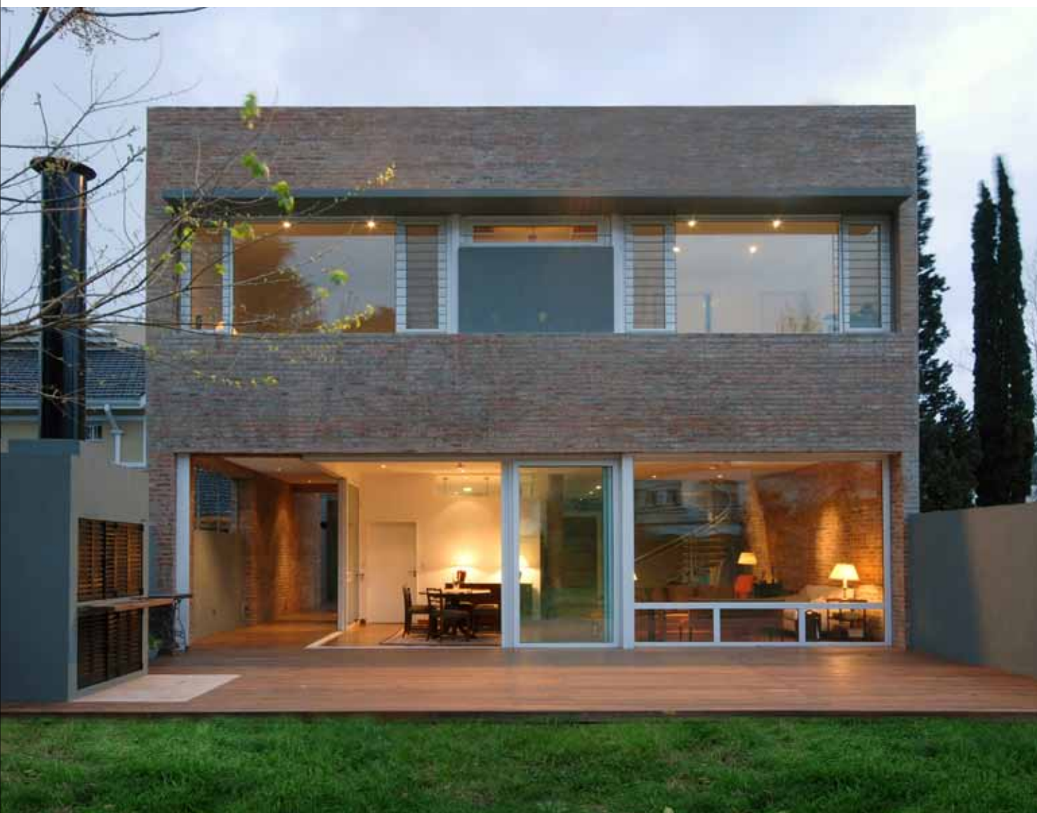
Ramen zijn overheersende vormgevingselementen.

Wie vandaag renoveert, verbouwt of een nieuw huis ontwerpt, beschikt over totaal andere en betere voorwaarden dan dit enkele jaren geleden mogelijk was. Want onderzoek en ontwikkeling hebben de raamtechniek duidelijk verbeterd en de productieprocedures werden verder ontwikkeld zodat vandaag hoogwaardige ramen aan betaalbare prijzen te verkrijgen zijn.