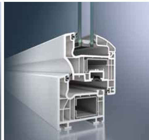
Schüco Corona CT 70 Cava

De ronde softform-lijnvoering van de Rondo-raamvleugel reduceert optisch de aanzichtbreedten van de toch al slanke profielcontouren. Dankzij de rondingen hebben de profielen een hoger zelfreinigingsvermogen en worden de reinigingscycli beperkt.